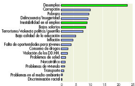
Gráfico 1.1 Problemas más importantes para los latinoamericanos (En porcentaje de respuestas)

Nota: Promedio de respuestas en 17 países de América Latina.